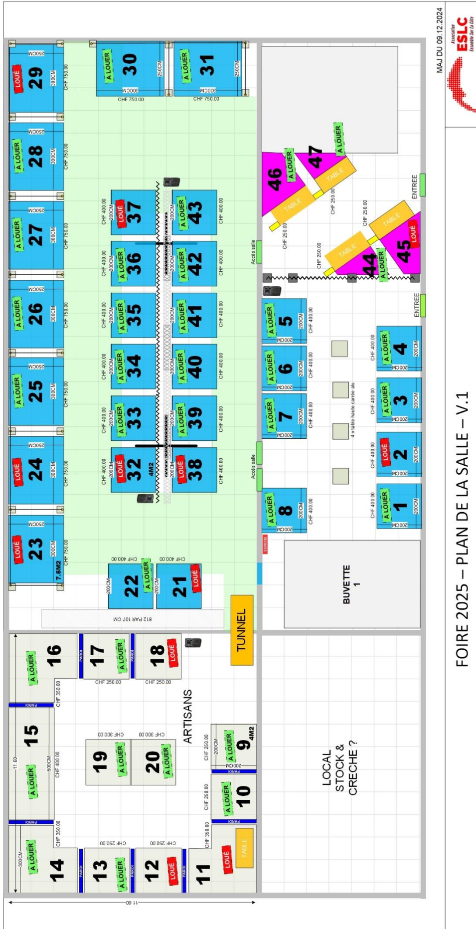
FOIRE 2025 – PLAN DE LA SALLE – V.1